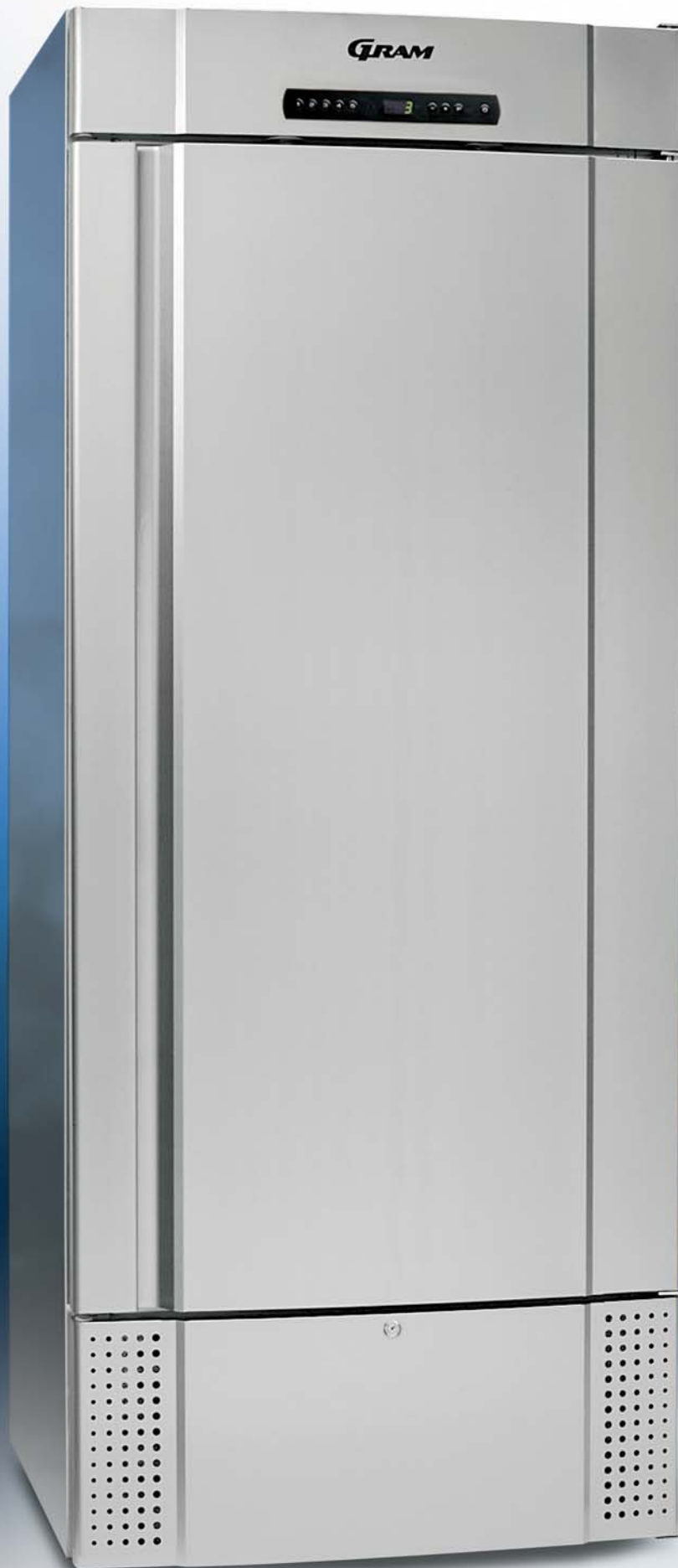
MIDI 625 CX