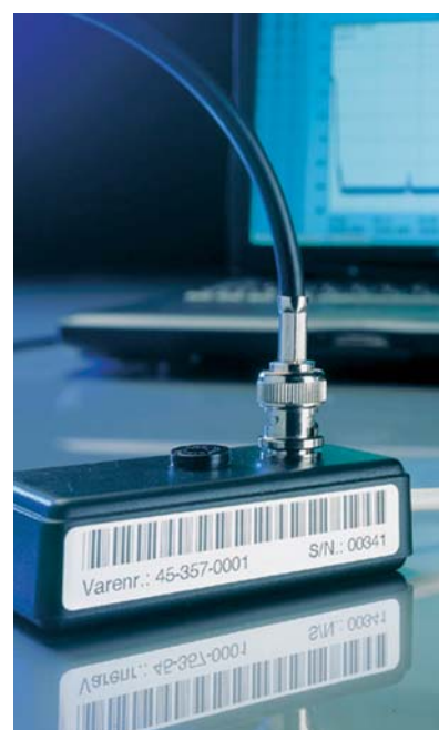
Gram Data Logger