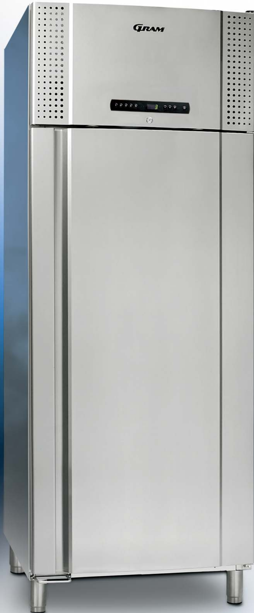
TWIN 660 CX