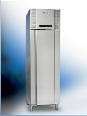
EURO 500 CX