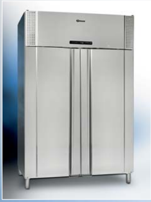
PLUS 1400 CX