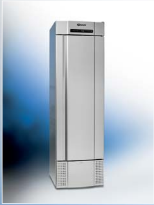
MIDI 425 CX