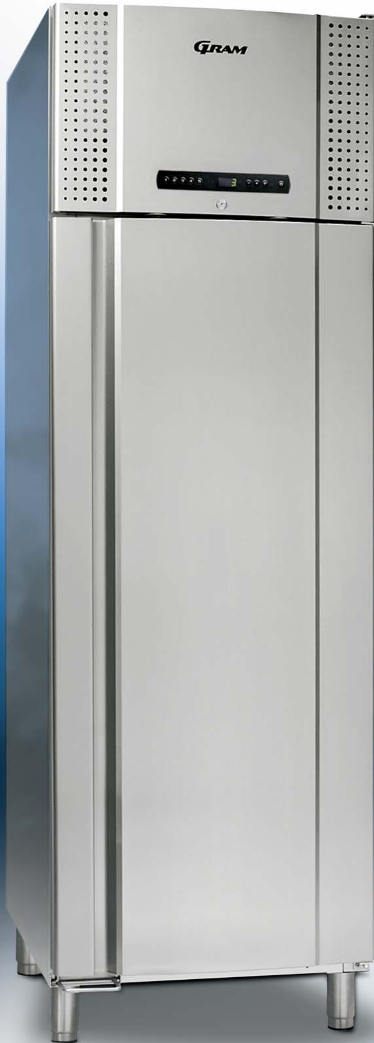
PLUS 660 CX